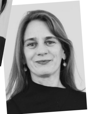
Phöbe Heydt Kommunikation